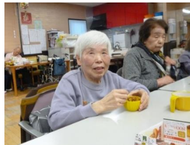
お味はいかがですか？