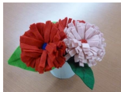
キレイな花が出来上がりました