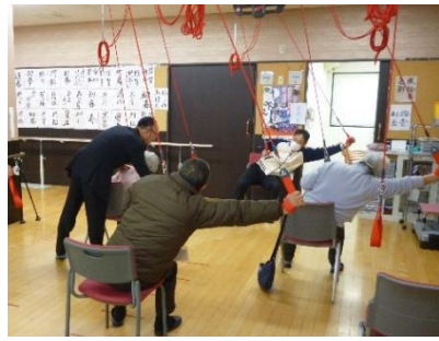
レッドコードの体験会

というキャッチフレーズを掲げ前年度は介護教室を四回開催しました。その締めくくりとして、在宅介護で困っている悩み事など、なんでも相談できる機会を作りたいという思いから二月九日に介護相談フェアを開催しました。