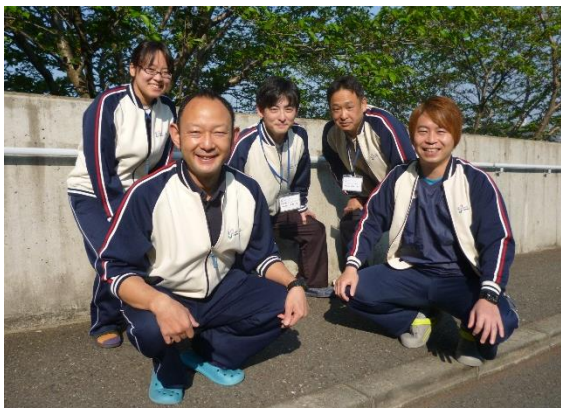
訪問リハビリのスタッフです！！

リハビリテーションという言葉を知っていますか？ストレッチやマシントレーニング、歩く練習などではないでしょうか。多くの方は病院でのリハビリテーションを思い浮かべておられると思います。訪問でのリハビリでは、私たちリハビリスタッフがご自宅に訪問し、運動指導を行っています。立ち上がり練習や歩行練習だけではなく、病院では中々できない調理の仕方や、安全なお風呂の入浴方法、使い易い福祉用具の提案、手すり設置などの住宅改修など、様々なお困りごとに対して提案させてもらっています。また、普段介護をされておられる方に、体に負担をかけない介助方法もお伝えしております。リハビリと聞くと怪我や入院してからするものという印象を、お持ちの方もおられるかと思いますが、それ以外に予防も非常に重要なことです。「最近家の中で躓くようになってきた」「浴槽を跨ぐのに力があるな」「さっきも同じ話をしていたな」など感じることはありませんか？そのような様子があれば、運動指導や楽に実施できる方法の提案をさせていただきます。どんな些細なことでもご相談にのりますので、まずは担当ケアマネージャーに伝えていただければと思います。