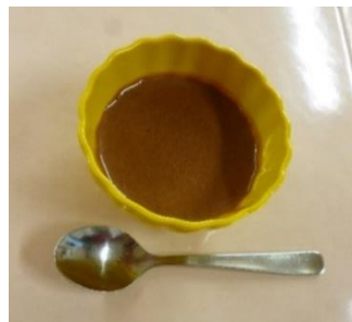
美味しそうですね！

三月のおやつレクではチョコレートムースを作りました。女性の利用者様が一生懸命作ってください、甘すぎず男性の方にも好評でした。普段食べる機会があまりないので、皆さん喜んで召し上がってくださいました。