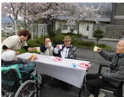
みんなでかんぱい！

あんりの桜の木も十五年目となり、今年も綺麗な桜の花を咲かせてくれました。四月三日、満開の桜の下で、葛城ユニット花見会を行いました。少し風があり肌寒さを感じることもありましたが、ポカポカ陽気で花見日和となり、みんなで美味しくケーキとジュースを召し上がっていただきました。乗年も同じメンバーで花見をしたいねと話しながら楽しいひとときを過ごすことができました。