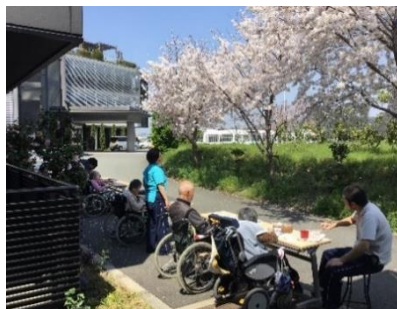
すごく良い景色です

スの影響により外出ができていませんでした。喫茶当日は天候が良かったので、玄関前で急遽開催しました。桜を目の前に皆さんは「これええな」「いつもよりケーキが美味しい」など大変喜ばれていました。いつもの喫茶ではもう食べたから部屋に連れてってと仰られる方も まだここにいとく。帰るのもつたいないわなどと、長時間おられる方も多くいました。入居者様同士での談笑される場面や、笑顔が多く見られました。少しでも皆様に四季を感じていただける取り組みを今後も行ってきたいと思っています。