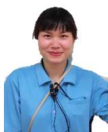
特定技能介護職員 あんり1F配属