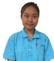
特定技能実習生 あんり2F配属