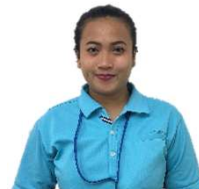
特定技能実習生 あんり4F配属