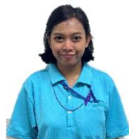
特定技能実習生 ゆうり配属