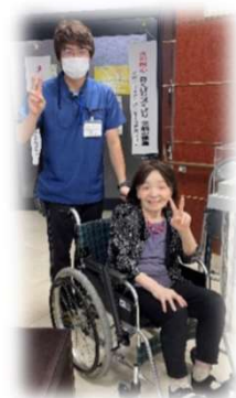
機能訓練中の様子 笑顔が素敵です！