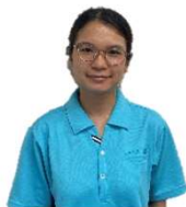
特定技能介護職員 ゆうり配属